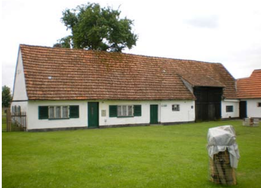
Das Forsteranwesen.