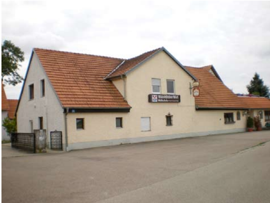
Das Gasthaus im renovierten Zustand. Foto: Dr. Hans Perlinger, 2008.