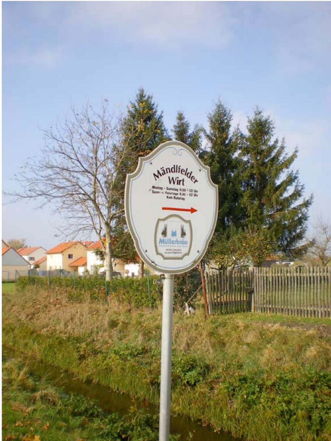
Hinweisschild auf den Ortswirt 2008.