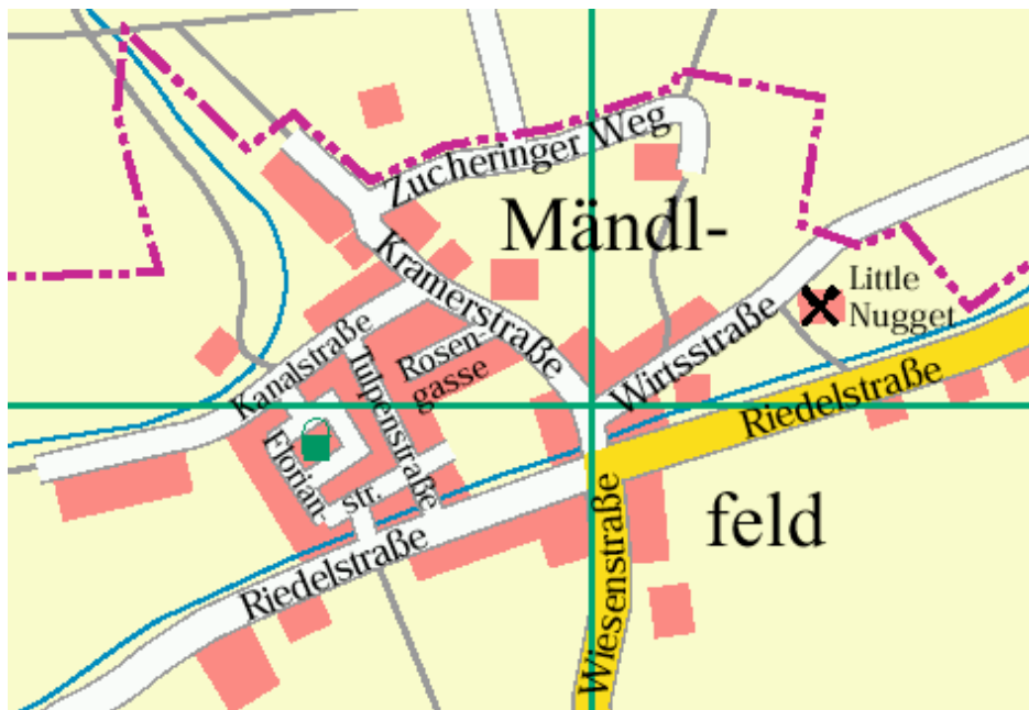
Übersichtskarte Mändlfeld. Karte im Besitz der Gemeinde Karlskron.