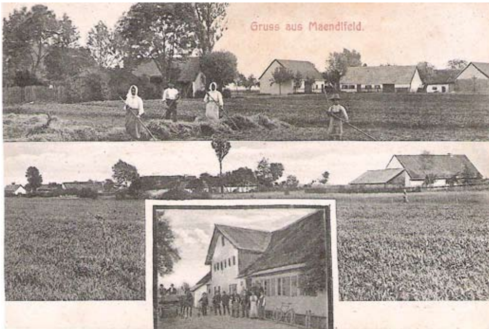
Die Postkarte zeigt verschiedene Ansichten von Mändfeld und im Fenster unten das außerhalb des eigentlichen Dorfes liegende Wirtshaus. Es wurde zur damaligen Zeit noch mit einer Pferdekutsche gefahren.