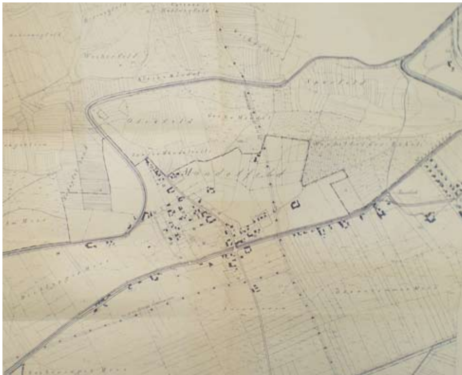
Vermessungskarte von Mändlfeld von 1867. Im Besitz der Gemeinde Karlskron.