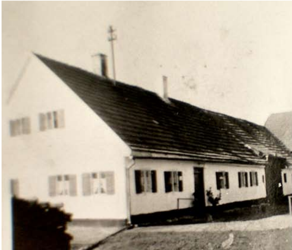
Das „Piedermayer Anwesen“.