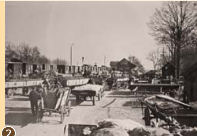
2 Verladung von Kartoffeln aus dem Donaumoos am Bahnhof Niederarnbach, um 1954.