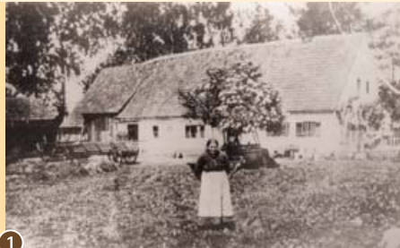
1 Rami-Hof, Fotografie um 1900.