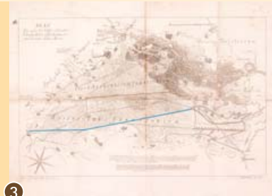
3 Donaumoos-Karte von 1792.