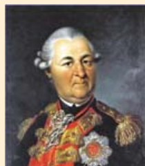
Kurfürst Karl Theodor 1724 – 1799.