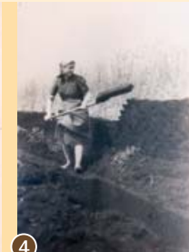
4 Torfstecherin im Donaumoos, um 1954.