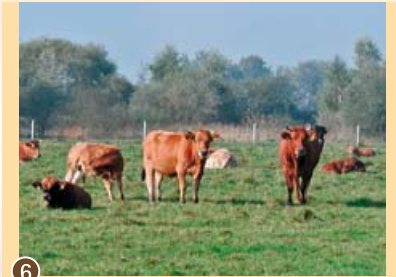
6 Rinder auf der Weide, 2005.