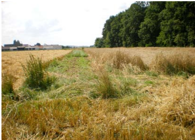
Der alte Weg nach Aschelsried als Grünstreifen sichtbar. Der Weg nach rechts führt zur Kapelle. Der Weg geradeaus führt nach Aschelsried.