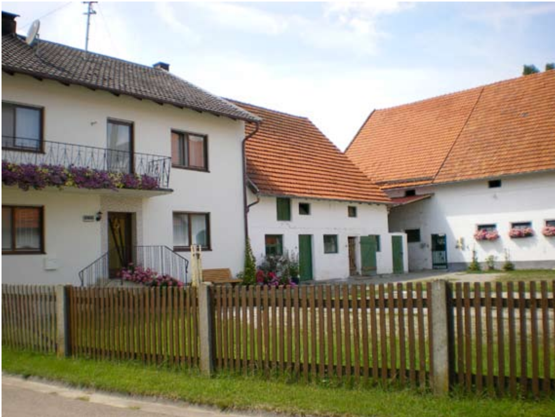
Landwirtschaftliches Anwesen mit dem Hausnamen „Veit“. Foto: Dr. Hans Perlinger, 2008.