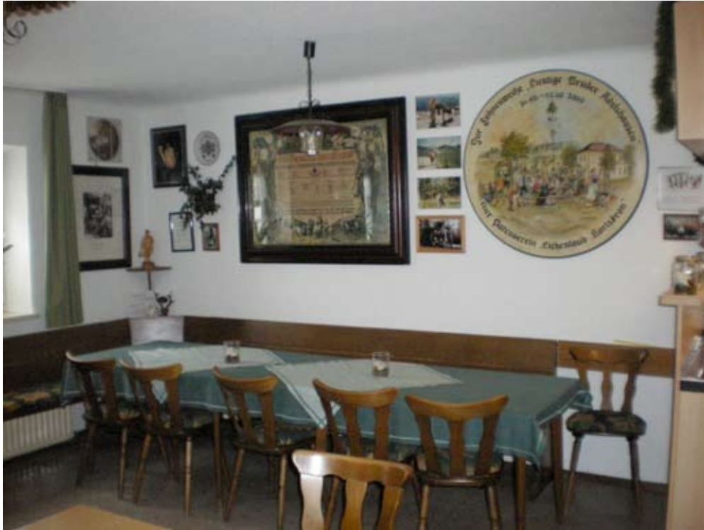
Dies Ostseite der Gaststube mit Ortsansicht, Kriegergedenktafel und Schützenscheibe. Foto: Dr. Perlinger , 2009.