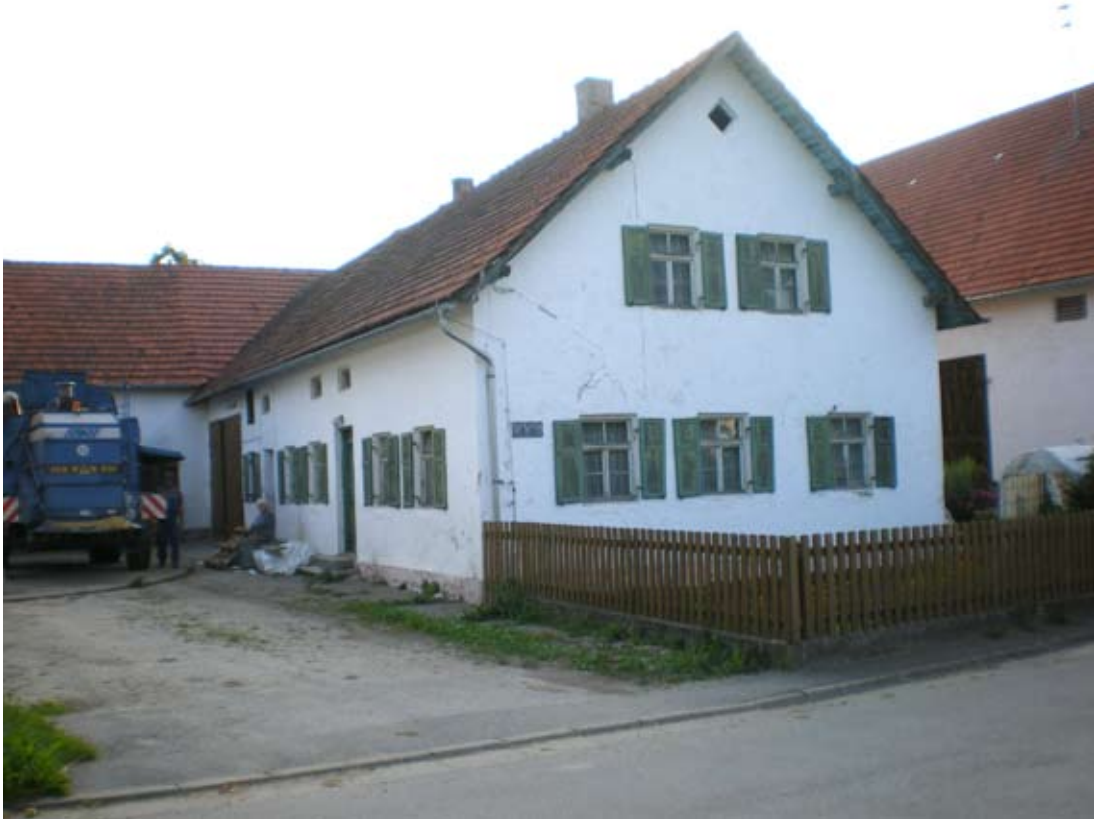
Ehemaliges landwirtschaftliches Anwesen. Es ist nicht mehr bewohnt und dient nur noch als Reparaturplatz für landwirtschaftliche Maschinen und Lagerplatz. Foto: Dr. Hans Perlinger, 2008.