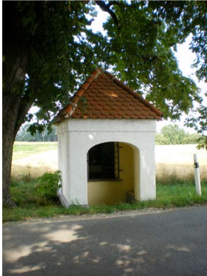
Kapelle zwischen Aschelsried und Waltung, an der historischen Abbiegung nach Aschelsried. Mittelfigur: Jesus Christus. Links daneben: Maria. Rechts: Das Jesuskind.