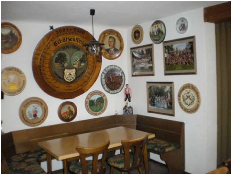
Südseite der Gaststube mit Schützenscheiben und Vereinsfotos.