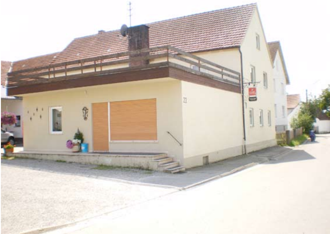
Gasthaus Felber mit Lebensmittelladen. Heute mit Getränkemarkt. Foto: Dr. Hans Perlinger, 2008.