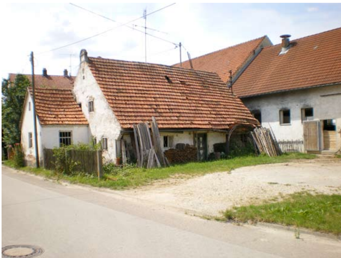
Restbestand eines alten Hofes. Foto: Dr. Hans Perlinger, 2008.