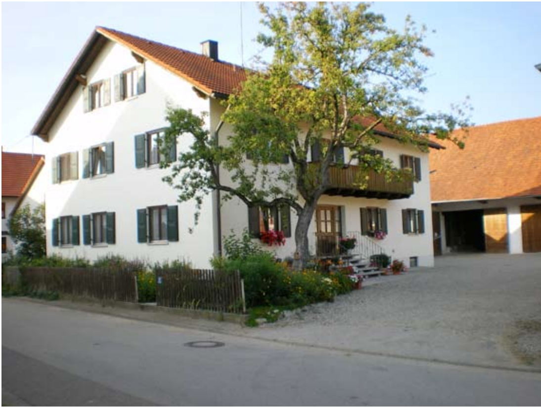
Landwirtschaftliches Anwesen.