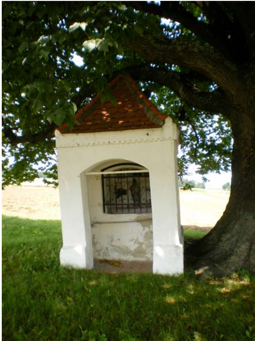
Die „schiefe“ Marienkapelle am westlichen Ortsrand von Aschelsried an der alten Linde. Foto: Dr. Hans Perlinger, 2008.