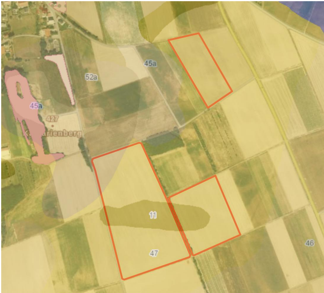
Abbildung 1: Auszug aus Übersichtsbodenkarte 1:25.000