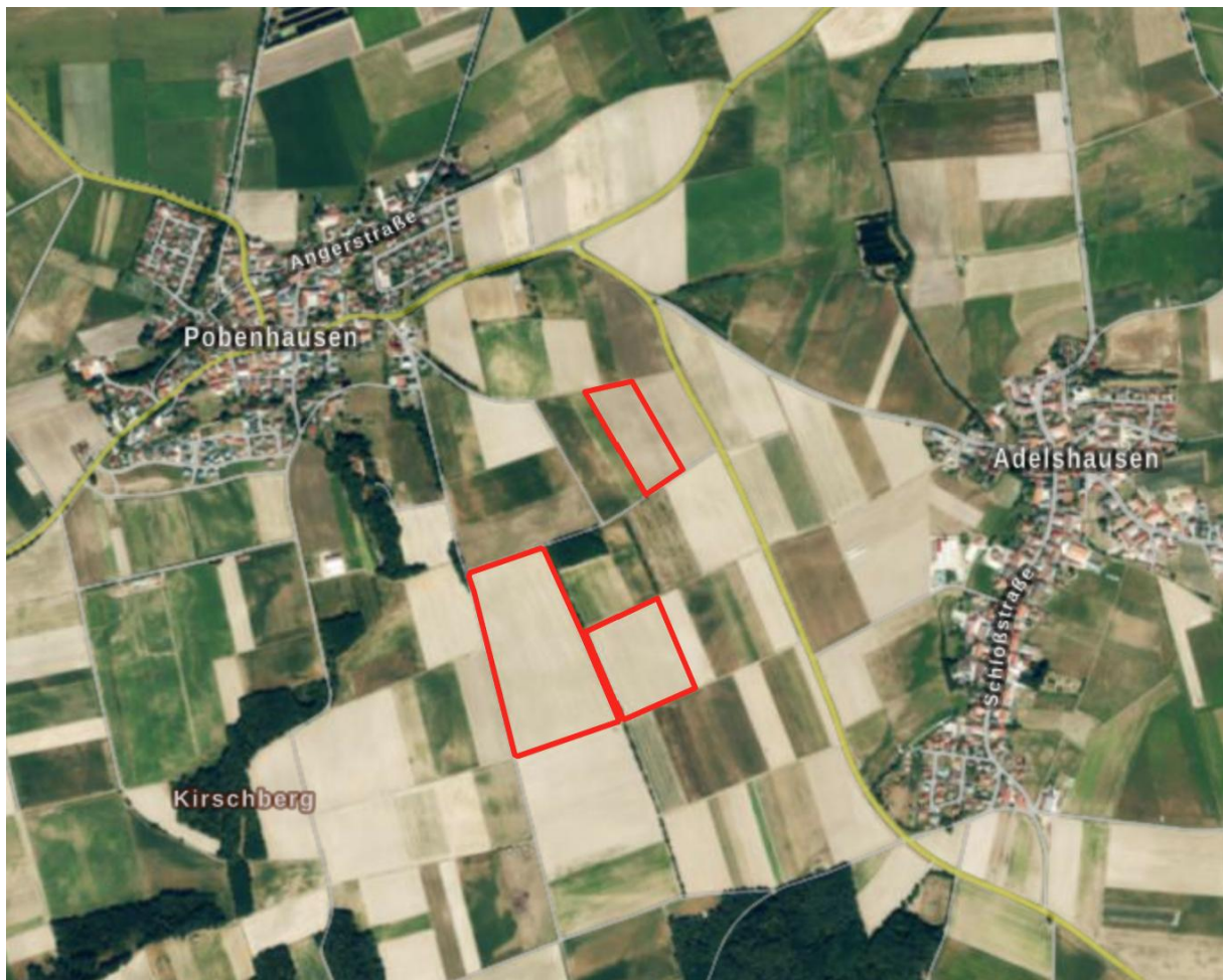
Landschaftsbild - rot: Geltungsbereich des Planungsgebiets;

Der Geltungsbereich im Norden durch Flurwege begrenzt, sowie von landwirtschaftlichen Flächen, es befinden sich am Rand des Planungsgebiet vorhandenen Gehölzstrukturen diese werden durch die Bebauung nicht beeinträchtigt.