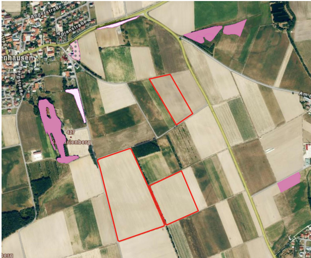
Abbildung 1: Auszug aus Biotopkartierung