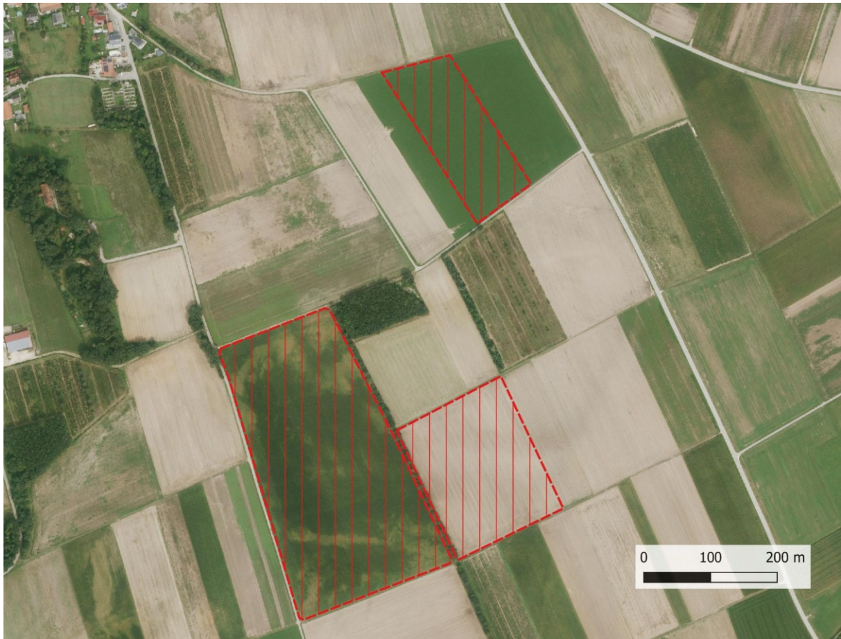
Karte 2: Geplante Flächen für den Solarpark

Die Flächen des geplanten Solarparks liegen außerhalb der Wiesenbrüter- und Feldvogelkulisse des Bayerischen Landesamtes für Umwelt (LfU) und außerhalb von FFH- und SPA-Gebieten (Natura 2000) sowie von Landschafts- und Naturschutzgebieten. Auch finden sich auf den Flächen und im direkten Umfeld keine Biotope der Bayerischen Biotopkartierung, das Biotop „Kalvarienberg bei Pobenhausen“ mit von Eichen dominierten Laubwald liegt etwa 100 m nordwestlich.