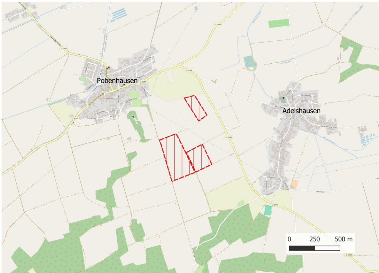
Karte 1: Übersichtskarte mit Umgriff des geplanten Solarparks (Kartengrundlage: OpenStreetMap)

Die beiden südlichen für den Solarpark vorgesehenen Flächen liegen auf einem nach Südosten geneigtem Hang, die beiden Flächen wurden 2024 als Acker (Mais und Getreide) genutzt.