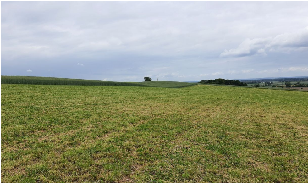
Foto 4: Nördliche Teilfläche, Blick nach Norden (frisch gemäht, 23.5.2025)