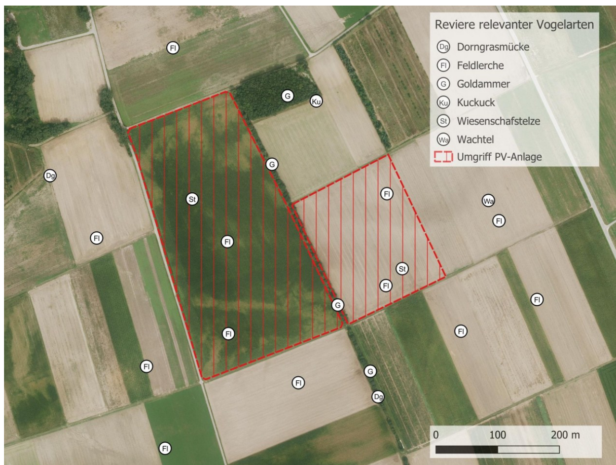
Karte 3: Revierschwerpunkte planungsrelevanter Vogelarten (bei Kuckuck nur Einzelbeobachtung, siehe Tabelle 5, Kartengrundlage: Bayerische Vermessungsverwaltung)

Wie aufgrund der vorhandenen Lebensräume zu erwarten, besteht die Vogelwelt des Untersuchungsgebiets vorrangig aus Offenlandarten, die auf den weitgehend offenen landwirtschaftlichen Flächen brüten sowie aus Arten von halboffenen Bereichen mit Hecken und Waldrändern. Letztere Gruppe besiedelt vorrangig die Baumhecke zwischen den beiden Teilflächen und das größere Feldgehölz im Nordosten des Untersuchungsgebiets. Typische Waldarten sind im Untersuchungsbereich kaum vorhanden.