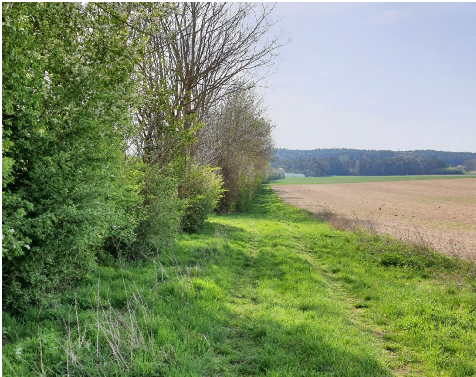
Foto 2: Westliche Teilfläche, Blick nach Süden (Baumhecke und Feldweg)