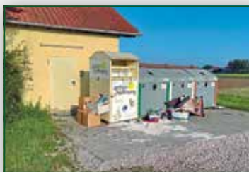
Sauberkeit an der Vakuumstation Mändlfeld Seite 6