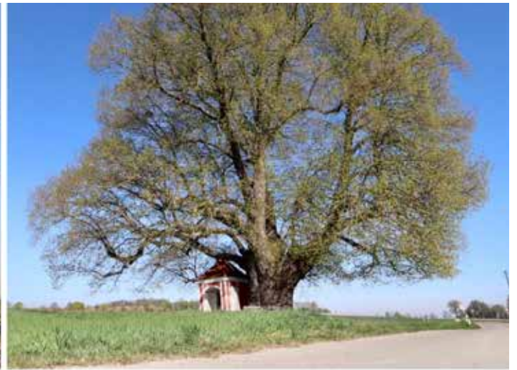
© Franz Richarz – Lindenkapelle Aschelsried