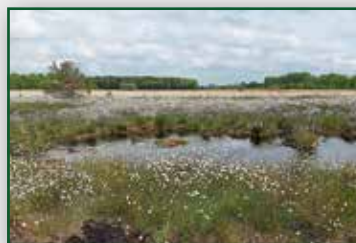
Von Steinzeitmenschen und Mammuts Seite 12