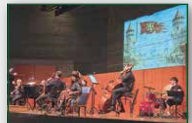
Mitmachkonzert 2./ 3. Jahrgangsstufe Seite 14